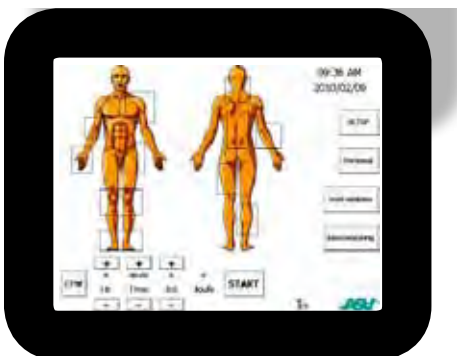
Interface de usuario con pantalla táctil

Código: 508457 - Aplicador Charlie para Mphi