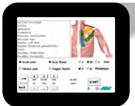
Modo Area con indicación de puntos gatillo